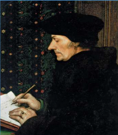
E. Rotterdamský Autor: Hans Holbein mladší