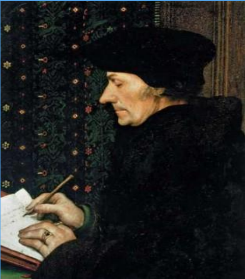
E. Rotterdamský Autor: Hans Holbein mladší